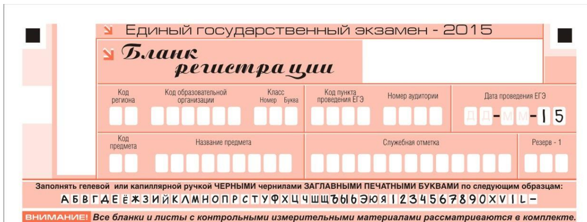
Рис. 2. Верхняя часть бланка регистрации

По указанию ответственного организатора в аудитории участники ЕГЭ приступают к заполнению верхней части бланка регистрации (рис. 2). Участником ЕГЭ заполняются все поля верхней части бланка регистрации (см. Таблицу 1), кроме полей для служебного использования (поля «Служебная отметка», «Резерв-1»).