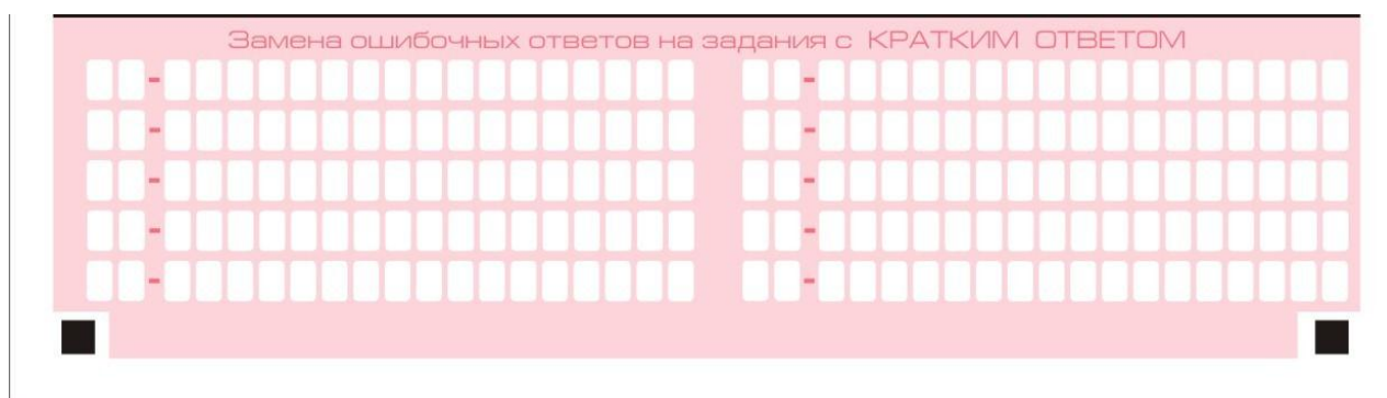
Рис. 8. Область замены ошибочных ответов на задания с кратким ответом

В нижней части бланка ответов № 1 предусмотрены поля для записи исправленных ответов на задания с кратким ответом взамен ошибочно записанных (рис. 8).